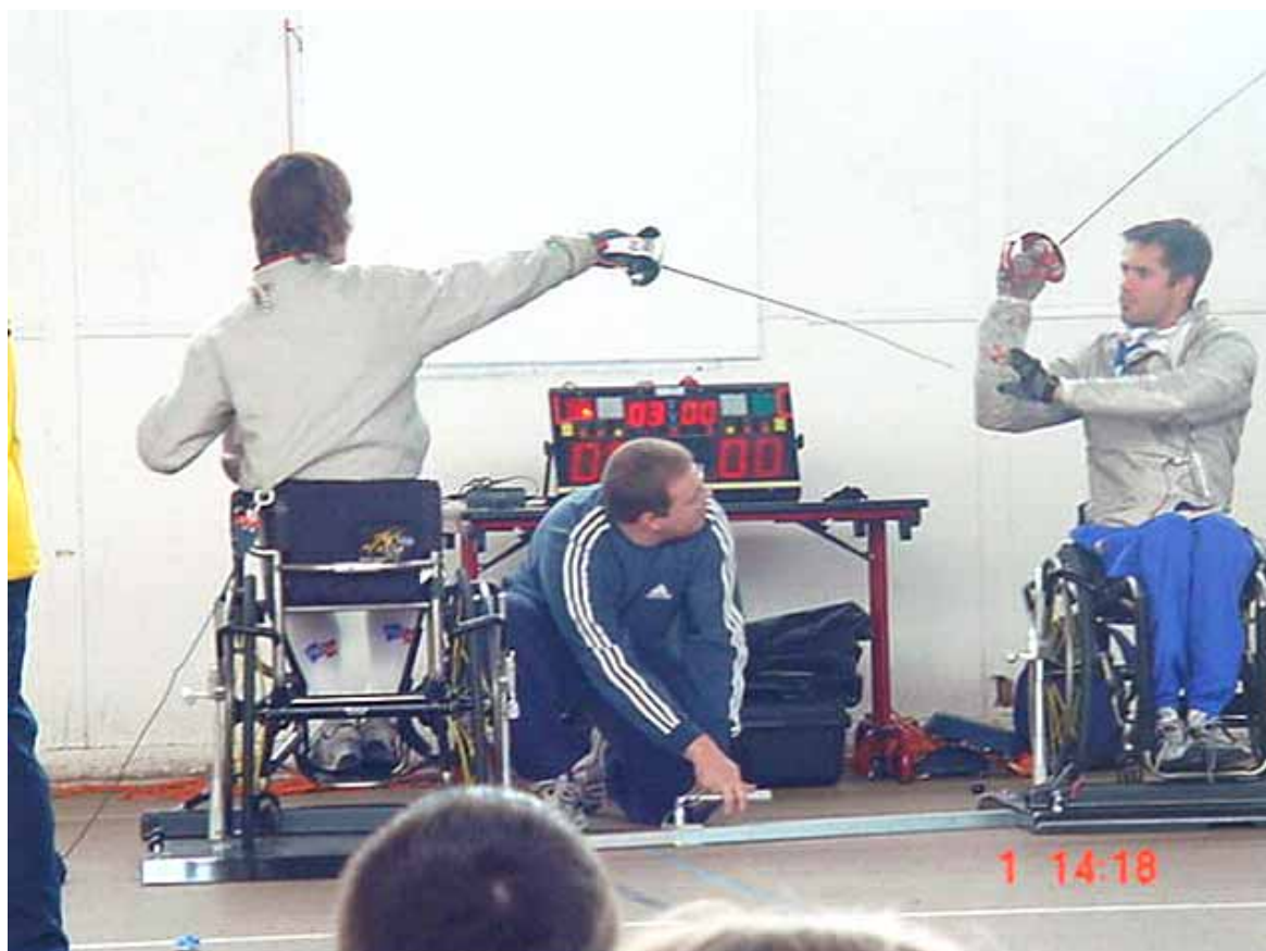
En démonstration : Cyril Moré (Champion Olympique handisport avec 7 médailles paralympiques)