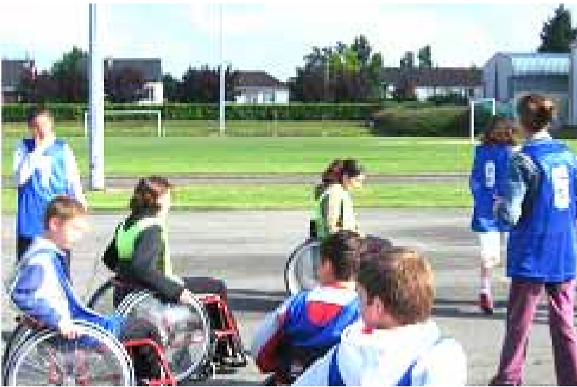
Hand mixte valide et fauteuil : un mélange d'entraide et de compréhension