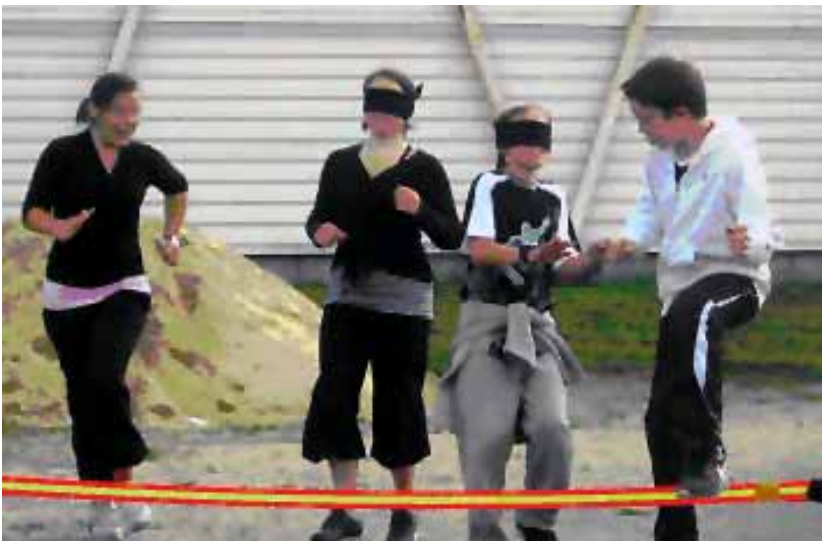
Tour de piste et obstacles multiples, le guidage à la voix ...une question d'écoute, mais aussi de confiance en l'autre