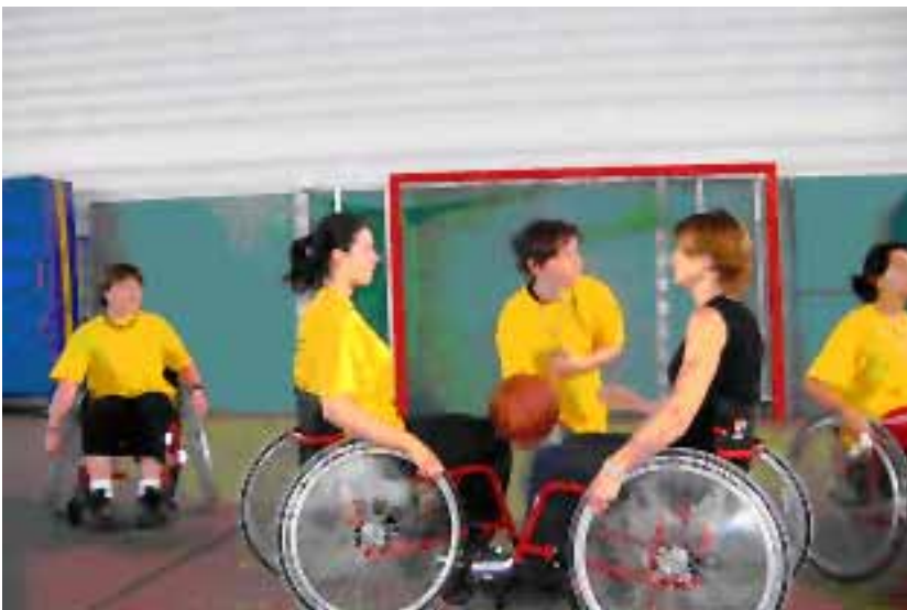
Le basket : une opposition maîtrisée ?