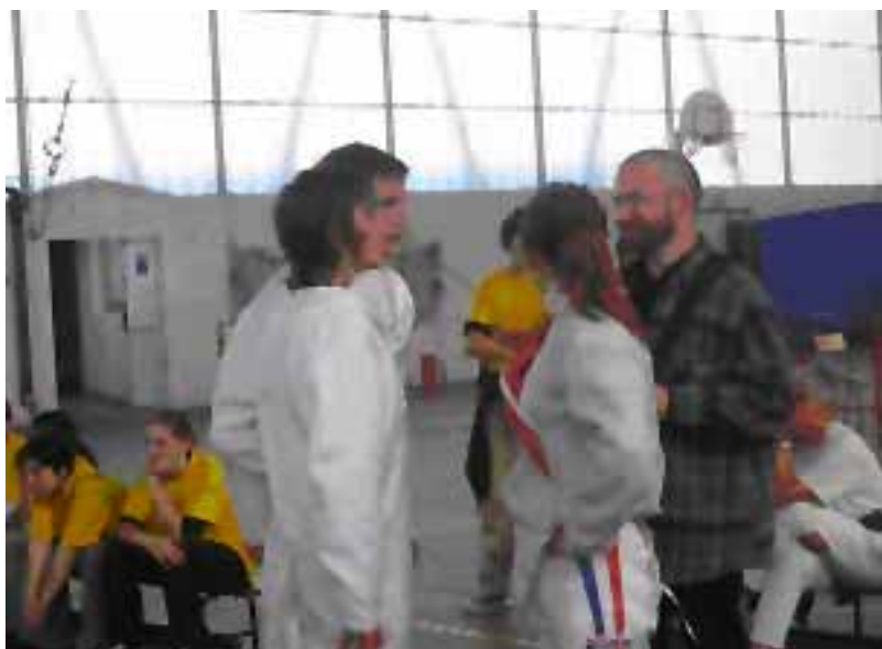
Les Escrimeurs du Pôle Espoir d'Orléans (Charles Péguy)

A la rencontre des élèves du collège Louis Pasteur