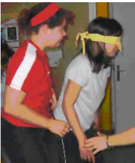
Parcours en salle d'agrès ....avec guide